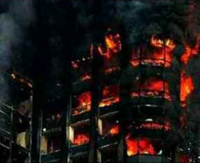
Un crash d'avion? Le feu?

http://www.darksideofgravity.com/AE911_videos/Building_Demol.avi