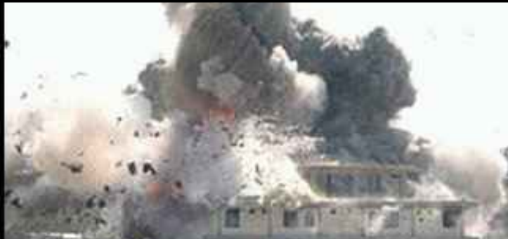
Une explosion ?