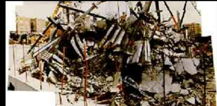
Un effondrement ? (Tremblement de terre)

...Chacun a un ensemble de caractéristiques très différentes et identifiables