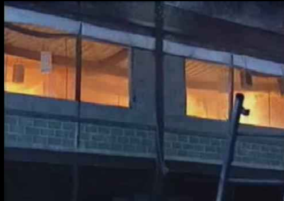
Tests de l'acier dans des feux de bureaux

http://www.darksideofgravity.com/AE911_videos/Fire_and_steel.wmv