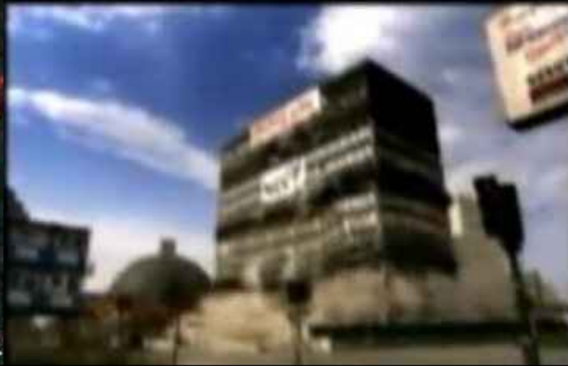
Une démolition contrôlée ?