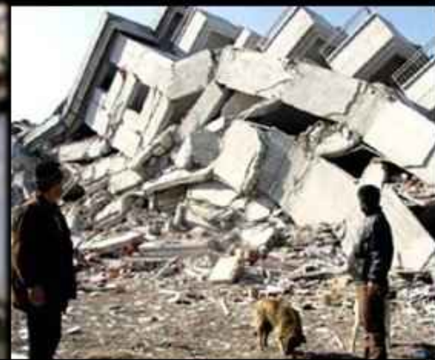
Un Effondrement ? (Tremblement de terre)